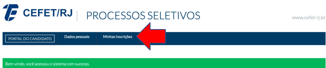
Figura 2 - Portal do Candidato – Tela de entrada

5.4. Após o acesso à conta, clique em “Minhas inscrições”.