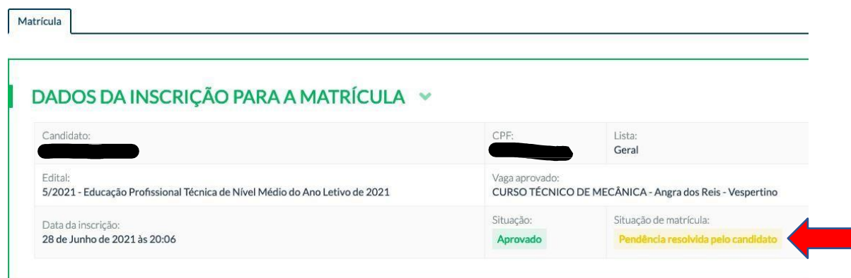
Figura 17 – Pendência resolvida pelo candidato

6.3. Após anexar novamente todos os arquivos que estavam marcados com pendência, clique em “Concluir matrícula”. Após, a situação de matrícula passará a exibir “Pendência resolvida pelo candidato”.