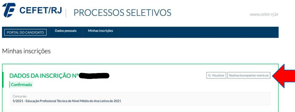
Figura 3 - Portal do Candidato – Realizar matrícula

5.5. Na tela de inscrições, verifique o Edital em que foi aprovado e clique em “Realizar/acompanhar matrícula” (o edital da ilustração a seguir é um exemplo)